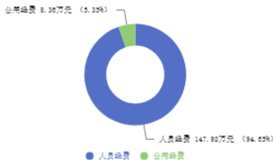
一般公共预算基本支出预结构图

新乡国家级自然保护区综合服务中心2025年一般公共预算基本支出年初预算为156.28万元。其中：人员经费147.92万元，占94.65%，主要包括：基本工资、津贴补贴、奖金、绩效工资、机关事业单位基本养老保险缴费、职工基本医疗保险缴费、其他社会保障缴费、住房公积金、退休费；公用经费8.36万元，占5.35%，主要包括：办公费、工会经费、福利费、公务用车运行维护费、其他商品和服务支出。